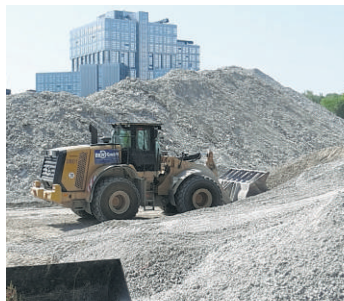
Ein kleines Gebirge aus Beton-Splitt der Post-Pyramide

die Grundstücksfläche bis Ende August aufgeräumt.“ Bei meist strahlendem Himmel muss der Staub laufend gebunden werden, ganz verhindern lässt sich die Belastung für die Anwohner nicht. „Regen höchstens an Wochenenden“ wünschen sich dennoch die beiden Chefs. Indessen sammeln Bauarbeiter per Riesemagnet Stahlteile. Große Brocken bringen Radlader zu zwei Betonbrechanlagen. In gewünschter Körnung kommen sie danach auf Halde. Dort warten schon Baulaster,